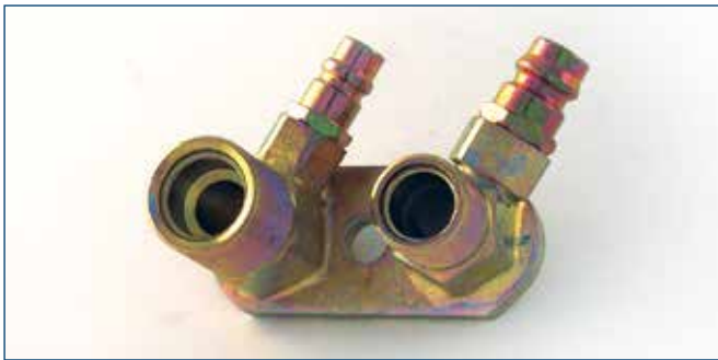
7/8"OR und 1 1/6"OR mit Füllventilen Druck- & Saugseite with service connection pressure and intake side