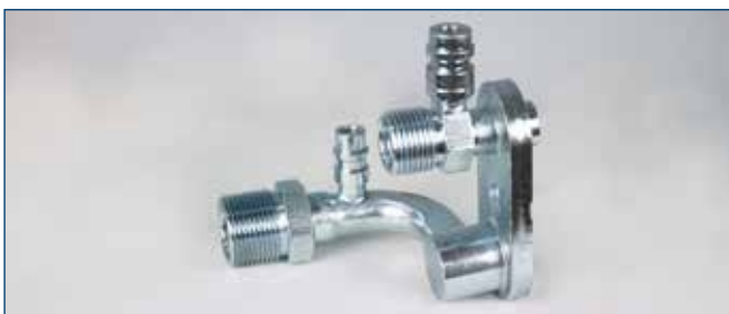
7/8"OR und 1 1/16"OR mit Füllventilen Druck- und Saugseite für 2. SD Kompressor-Anbau bei Sprinter CD with service connection pressure and intake side for 2. SD compr. mount at Sprinter CD