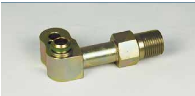
3/4"OR Druckseite / 3/4"OR high pressure side für Denso Kompressor 7SB16 for Denso compressor 7SB16