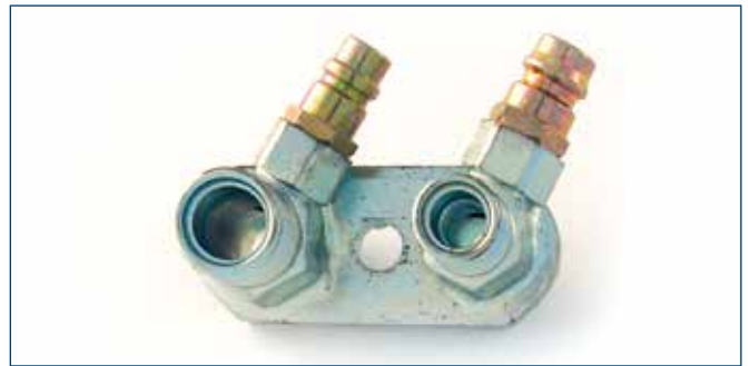
3/4"OR und 7/8"OR mit Füllventilen Druck- & Saugseite with service connection pressure and intake side