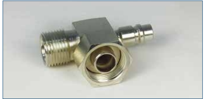
7/8"OR mit Füllanschluss Druckseite 7/8"OR with service connection intake side