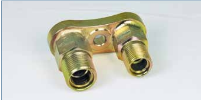
3/4"OR und 7/8"OR für Denso Kompressor 10PA15 for Denso compressor 10PA15