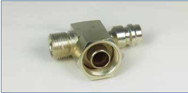
3/4"OR mit Füllanschluss Druckseite 3/4"OR with service connection pressure side