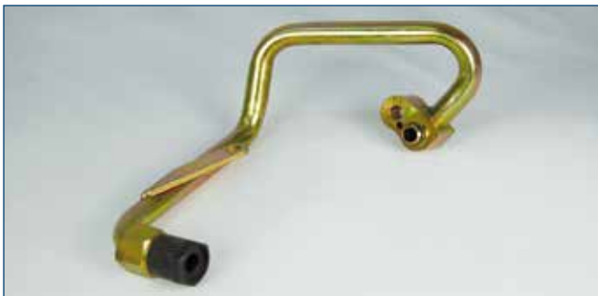
7/8"OR Druckseite / 7/8"OR high pressure side für Denso Kompressor 7SB16 for Denso compressor 7SB16