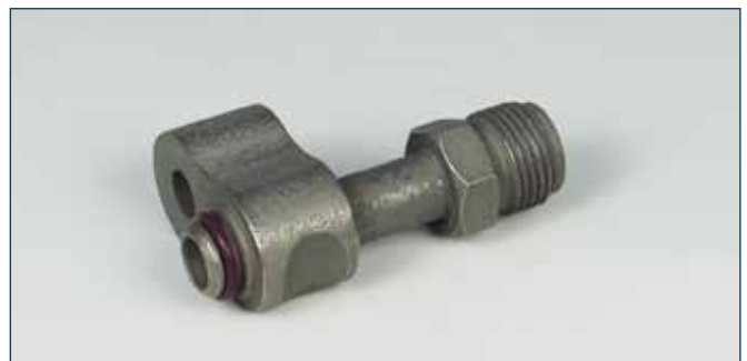
3/4" OR Druckseite / 3/4" OR high pressure side für Denso Kompressor 7SB16 for Denso compressor 7SB16