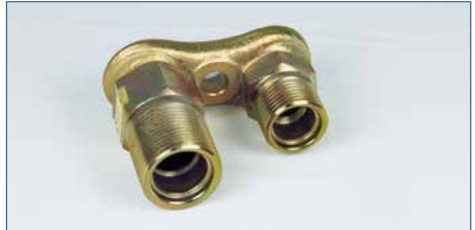
7/8"OR und 1 1/16"OR für Denso Kompressor 10PA15 for Denso compressor 10PA15