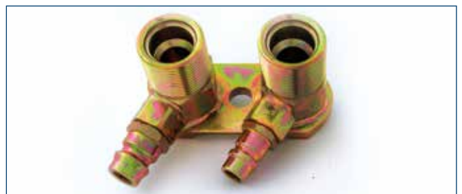
2x 1 1/16"OR mit Füllventilen Druck- & Saugseite with service connection pressure and intake side